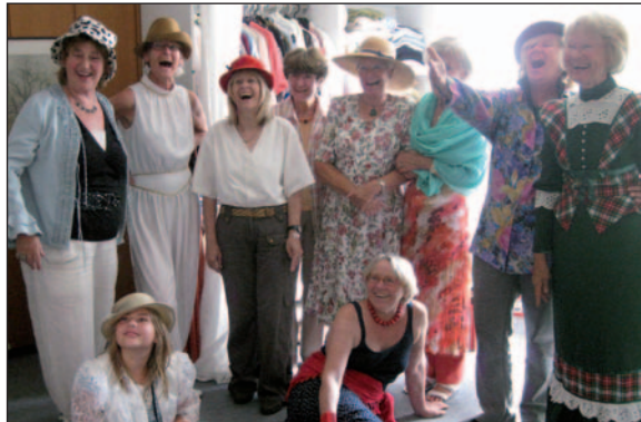
Freude und Gemeinschaft: Geburtstagsfeier in der Boutique.

spenstische Unruhe, die von den Rändern her in unser Leben hereinstrahlt.