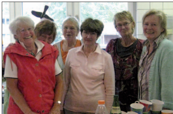
Fülle des Lebens: Spaß bei Arbeit und Gemeinschaft.

Auf dieses merkwürdige Geheimnis unseres Lebens hat Jesus uns aufmerksam gemacht, wenn er sagt: „Trachtet am ersten