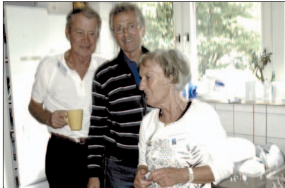
Ohne Küchenteam – keine Märkte!

und in beidem nicht an mich selbst denke.