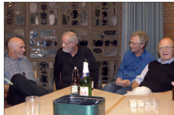
Hero, Heiner, Wilfried und Wilbrand arbeiten und feiern miteinander.

tive. Gott schenkt das Größte immer nur „nebenbei“. Das muss man sich merken.